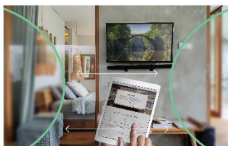
中間近用重視タイプ